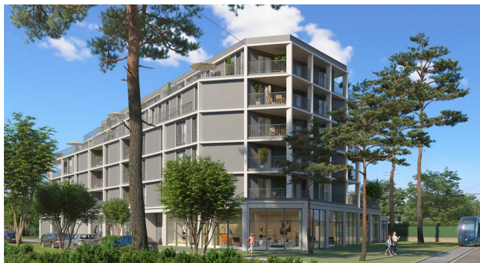
Programme AQPRIM - CORYLUS – PARC MIREPIN