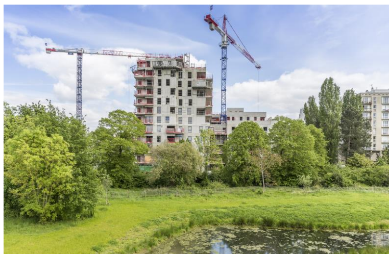
Les Cadets (Rennes)