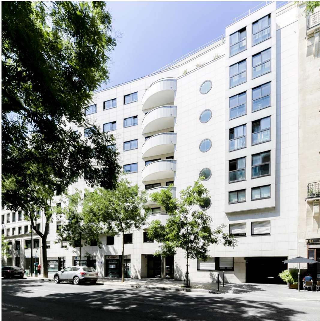
Programme Le Parc – 15 ème arrondissement - Catella Patrimoine